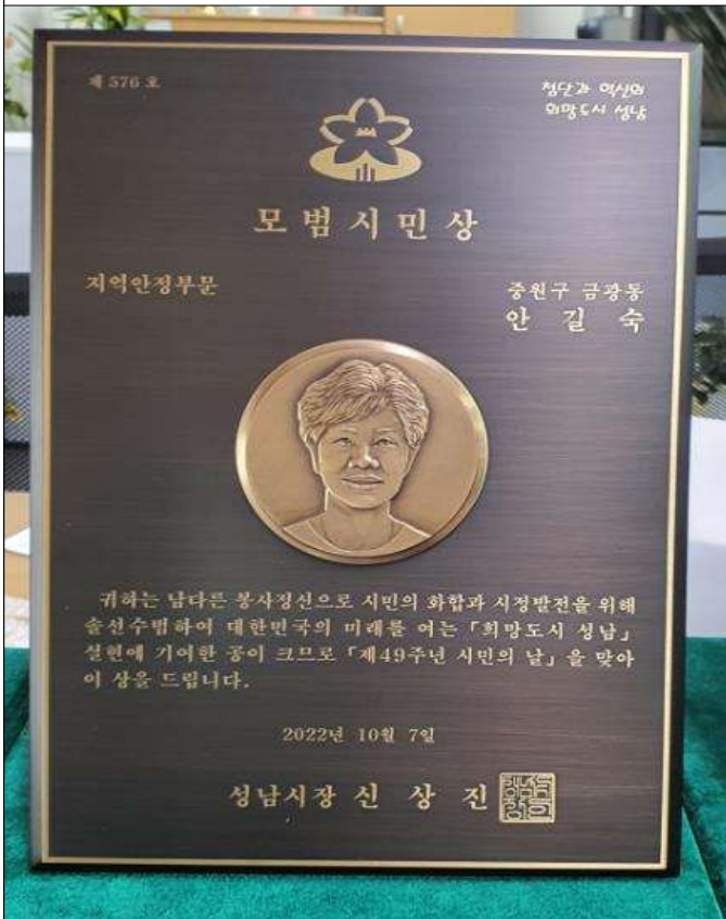
원목 상판에 금속 그림 프린팅 (22만원)